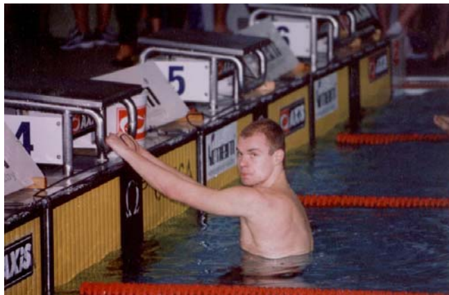
Nejlepší sportovec 2005 — Tomáš Fučík