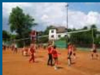
TJ Jiskra Dobronín zorganizovala ve svém sportovním areálu 21. 6. 2009 turnaj zákyň v mini-volejbalu.