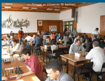
Gambit Jihlava zorganizoval v Lukách nad Jihlavou dne 25.4.2009 turnaj v rapid šachu. Turnaje se zúčastni- lo 56 šachistů všech věko- vých kategorií.