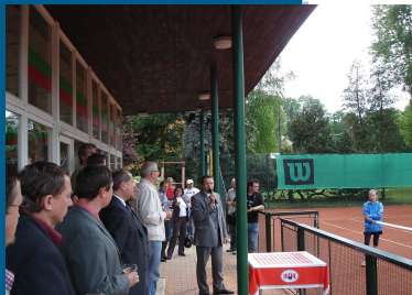
Slavnostní otevření zrekonstruovaných tenisových kurtů — Teniscentrum Jihlava 19. 5. 2009