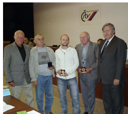
Funkcionáři TJ, SK ocenění na letošní VH

Další část jednání byla věnována ekonomice. Důkladně byla analyzována ekonomika ČSTV. TJ a SK se potýkají s nedostatkem finančních prostředků. Vlastní zdroje ČSTV se snižují. Nedaří se získat dodatečné zdroje finančních prostředků. Stejně tak objem státních prostředků směřujících do