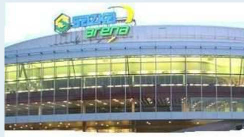
Sazka Arena — chloubou českého sportu a zároveň kyselé jablko financování z prostředků SAZKY

Jediným snad jistým zdrojem jsou v roce 2009 finance z kraje Vysočina, které jsou TJ a SK rozdělovány prostřednictvím Všesportovního kolegia kraje Vysočina. Tyto prostředky jsou děleny pouze na mládež do 18. let. V loňském roce činila tato dotace 100,- Kč na člena do 18. let. Věříme, že tento příspěvek zůstane stejný a TJ a SK tak zůstane alespoň minimální podpora na děti a mládež.