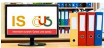
Informační systém ČUS